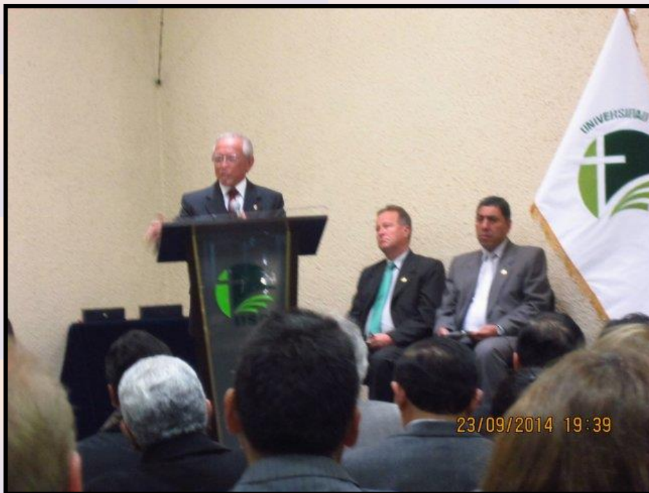
Congresista República del Perú, Pr. Humberto Lay en la exhortación de la Palabra